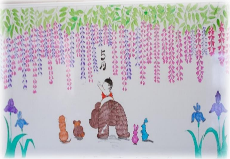
介護福祉士 松崎紗季 作