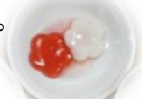
”母の日 お花ゼリー”

今月は、八十八夜の他に「こどもの日～ちらし寿司・チョコバナナ」、「母の日～塩焼そば・お花ゼリー」の行事食がありました。来月もお楽しみに☆