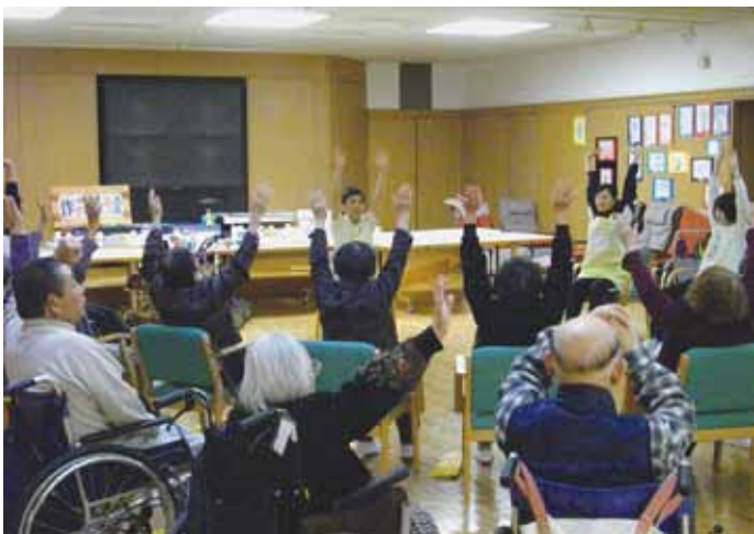
集団リハビリテーション