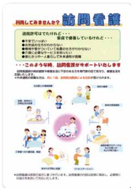
訪問看護利用のパンフレット