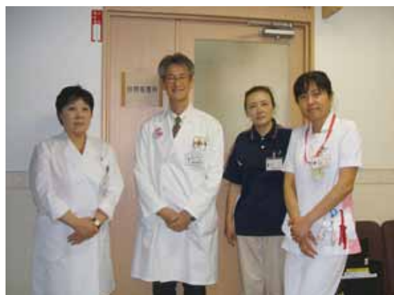
～訪問診療医師・訪問看護師～