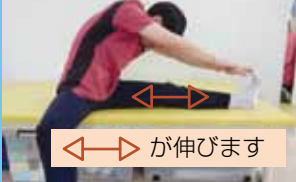
太もも後ろの筋肉