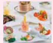
洋食又は中華のコース (料理は曜日により変更いたします)

お申込み・お問い合わせ JCHO うつのみや病院健康管理センター TEL (直通) 028-688-5522 028-688-5523 [受付時間] 平日 13時～17時