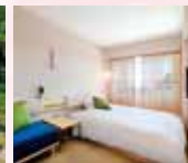
全館禁煙・無料Wi-Fi (お部屋はスイートへの変更も可能です)