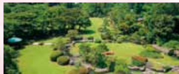
宇都宮グランドホテル歴史ある憩いの日本庭園