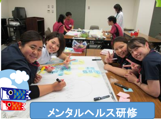
メンタルヘルス研修

新入職者を迎え、色々な研修が始まりました。みんなキラキラした目をして研修を受けています これから私たちも共に成長していきたいと思えます。