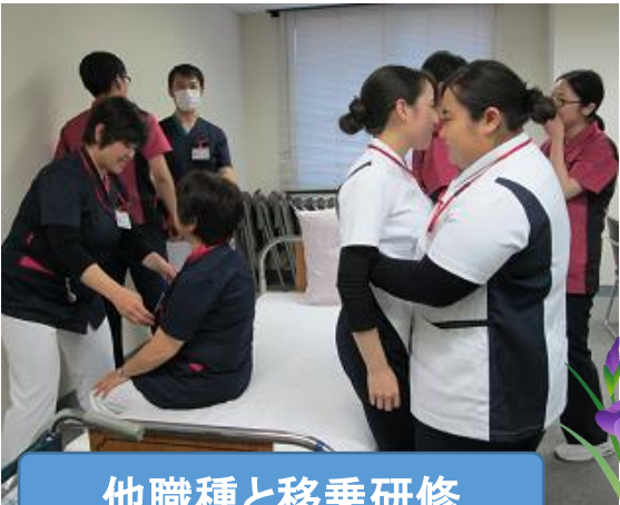
他職種と移乗研修