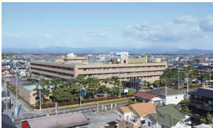
JCHO うつのみや病院全景