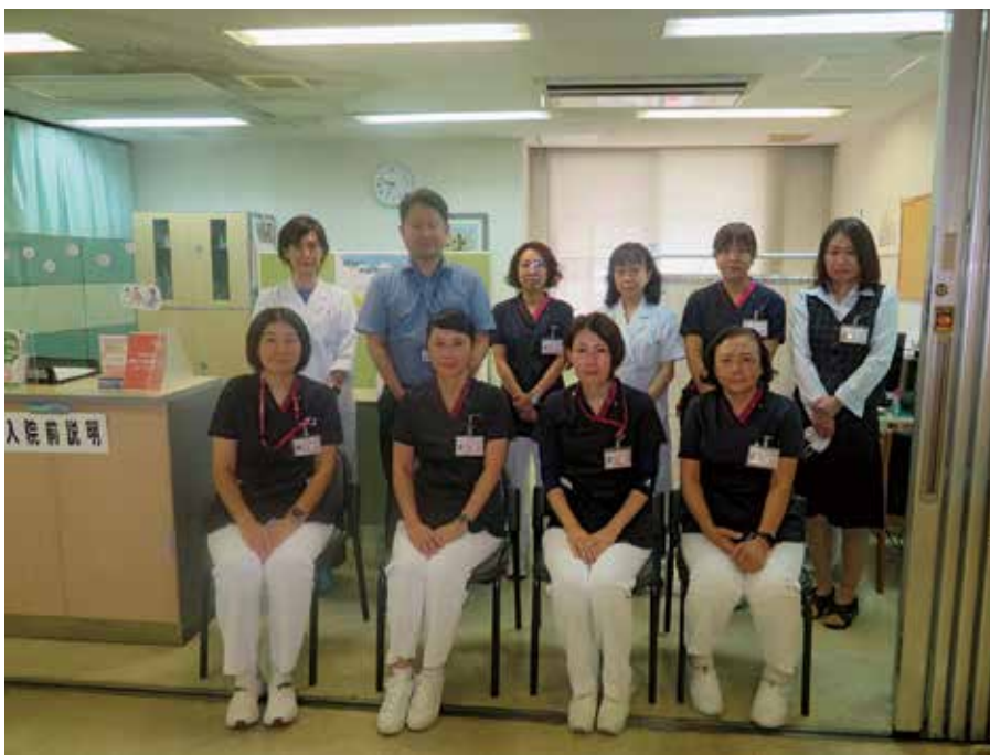
地域医療連携室スタッフ