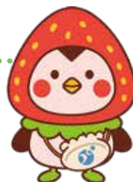
JCHO うつのみや病院 マスコットキャラクター みやチュン

JCHOうつのみや病院では、患者さんへのサポート活動としての院内ボランティアの受入れを行っております。ボランティアの方々のご協力を頂きながら、地域利用者志向の医療サービス提供機関として、患者さんへのサービス向上に努めてまいります。